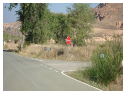
Cruce para subir hacia Alarilla

Tras pasar la ermita y a unos 50 metros a la izquierda, comienza la calle que lleva hasta La Muela. En esta calle (de La Muela), la última casa a la derecha es el local de nuestra escuela.